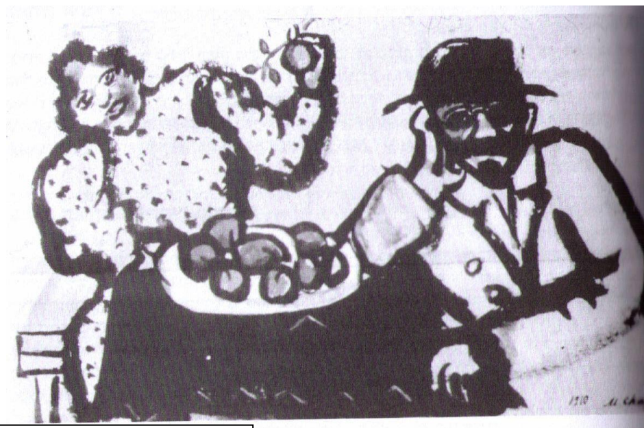
Адам и Ева Марк Шагал (1910)